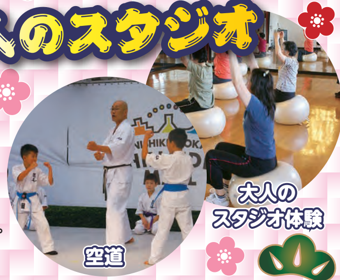
大人の スタジオ体験