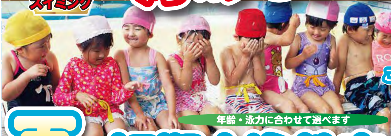
年齢・泳力に合わせて選べます