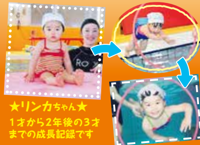
★リンカちゃん★ 1才から2年後の3才までの成長記録です

火・木・土 11:00~12:00 回数制限なしいつでも自由に参加できます 月会費/親子で5,000円